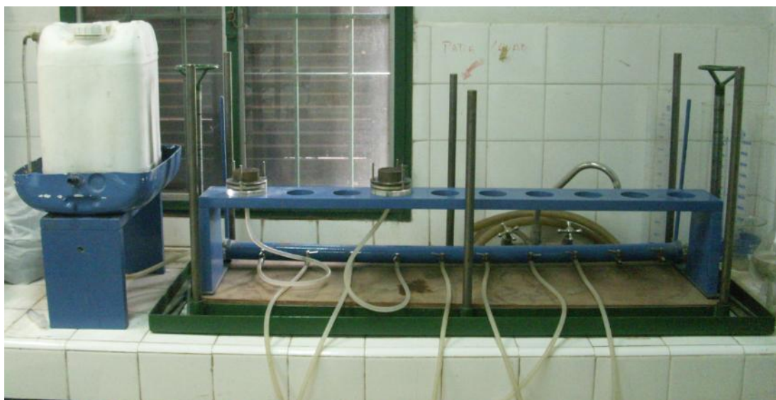
IMAGEN DE LA MESA DE TENSIÓN DESARROLLADA

Medias con una letra común no son significativamente diferentes ( p < 0,05 )